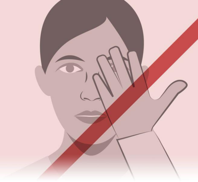
ناپاک لاسونه په سترگو، پوزه او خوله مه وهئ