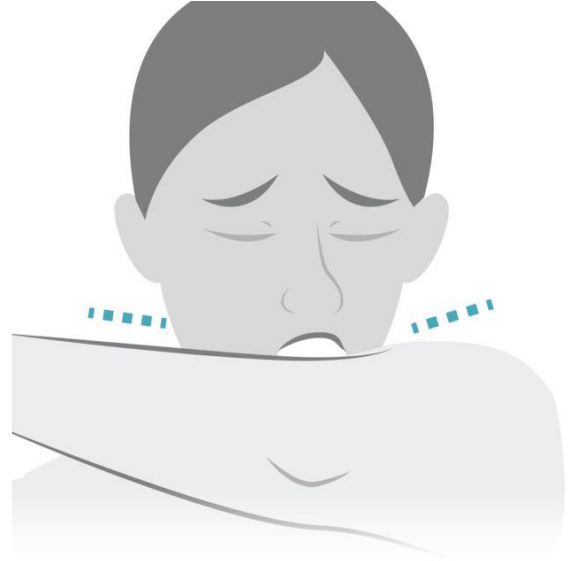
که ټيشو يا دسمال نه لرئ له لستوني کار واخلئ