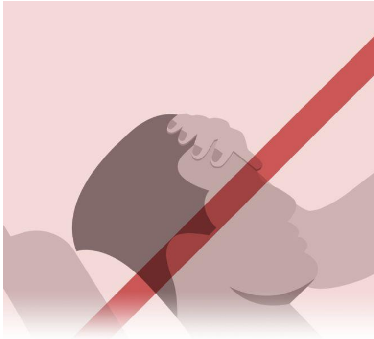
ناروغانو ته مه نژدې کېږئ