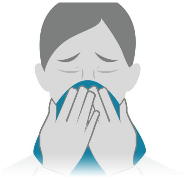
د پرنجېدو او ټوخي پر مهال ټیشو یا دسمال وکاروئ